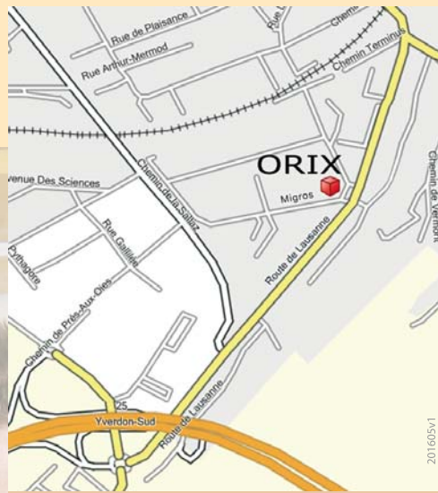
Nos locaux à Yverdon Sud, avec places de parc