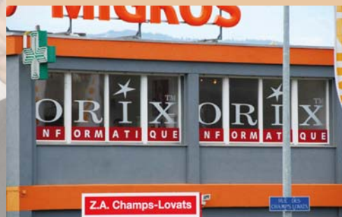
Des PC de qualité ORIX, fabriqués sur mesure