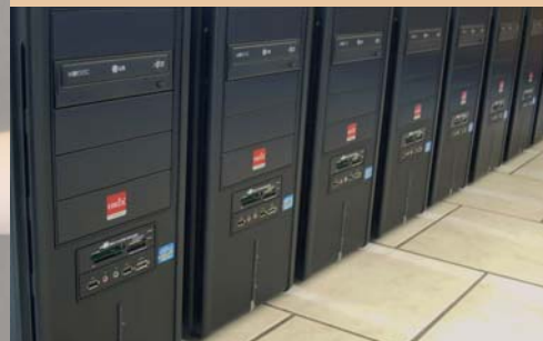
Une équipe de professionnels à votre service